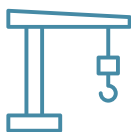
Grúa para WC